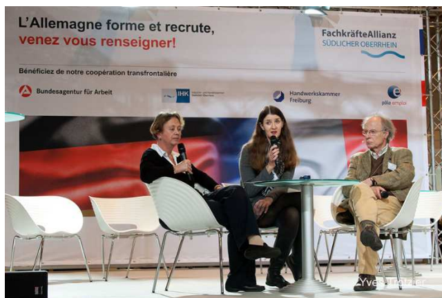
Les chargées de mission de l'INFOBEST Vogelgrun/Breisach lors de leur intervention en 2015.

Comme l'année dernière, l'accent sera mis également sur les opportunités d'emploi, de formation et d'apprentissage en Allemagne avec la présence au hall 3 d'un Pôle franco-allemand. Environ 80 exposants allemands (entreprises, services de l'emploi, CCI, institutions franco-allemandes ...) seront présents dont l'INFOBEST Vogelgrun/Breisach. Les chargées de mission de l'INFOBEST proposeront cette année également des ateliers sur le statut du frontalier (vendredi 27 janvier et samedi 28 janvier à 10h30).